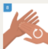
JOŠ JEDNOM TRILJAJTE VRHOVE PRSTIJU O DLAN DRUGE RUKU