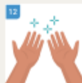
NAKON OVOGA VAŠE RUKU SU ČISTE