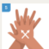
TRILJAJTE SA DONJE STRANE ŠAKE IZMEĐU PRSTIJU