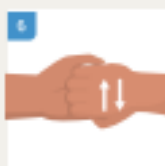
TRILJAJTE VRHOVE PRSTIJU ODRE ŠAKE