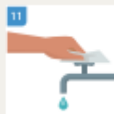
LOZITE NOVI UBRUS I NIM ZATVORITE ČESMU