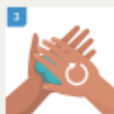
TRILJAJTE DLAN O DLAN